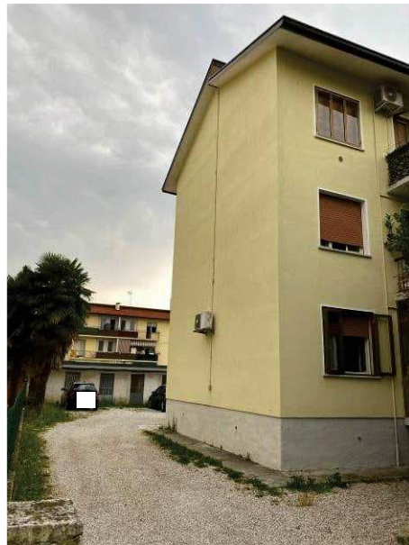
particolare prospetto lato nord