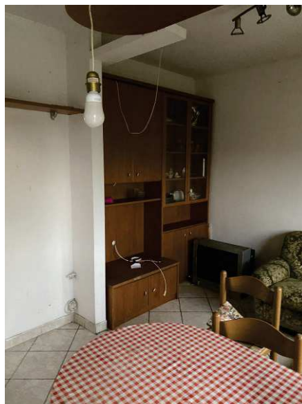
viste interne soggiorno