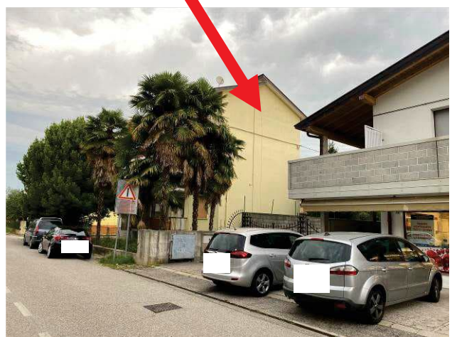
particolare prospetto lato sud