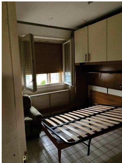
vista interna camera