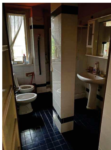
vista interna bagno