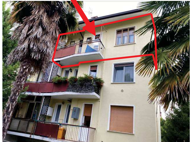
particolare prospetto principale lato ovest