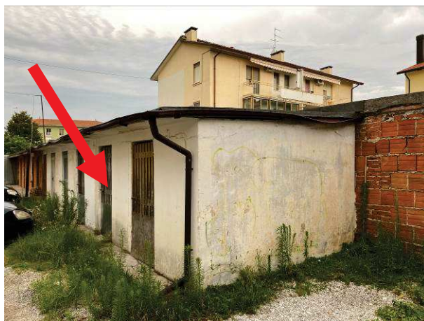
viste esterne ripostiglio al piano terra nell'adiacenza