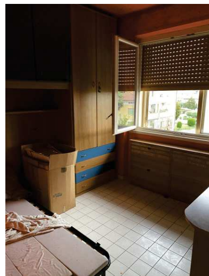
vista interna cameretta