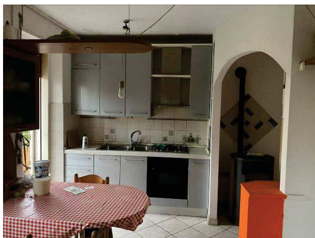
vista interna cucina