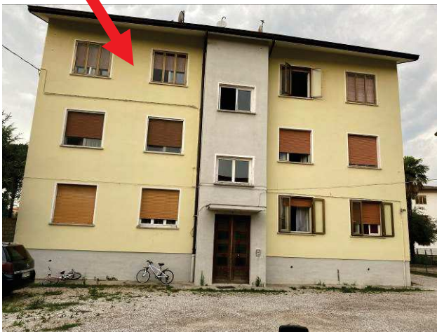
particolare prospetto lato est